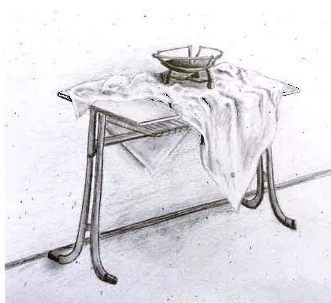
Ukázka kresby tužkou